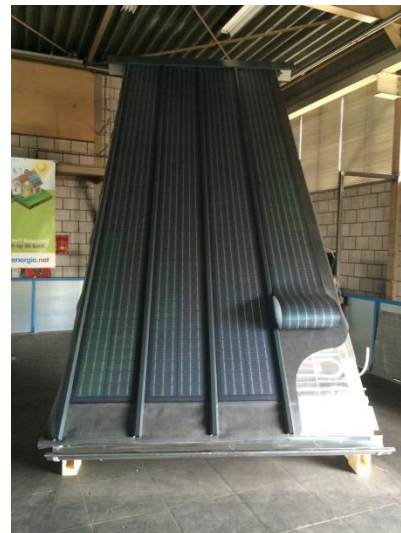
PowerPanel (versie 1.0)

Het PowerPanel verenigt alle basisfuncties van een duurzaam dak in zich: constructie en isolatie, thermisch en elektrisch rendement, waterdicht en good-looking. Een multifunctioneel dakpaneel met stekkers en slangen.