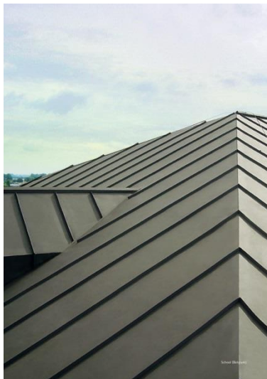
"Felsdak" in pvc-dakbedekking