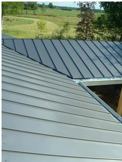
Felsdak in metaal

Het felsdak kent verticale lijnen en dat kan met dakbedekking ook worden nageemaakt, zoals onderstaande afbeeldingen laten zien.